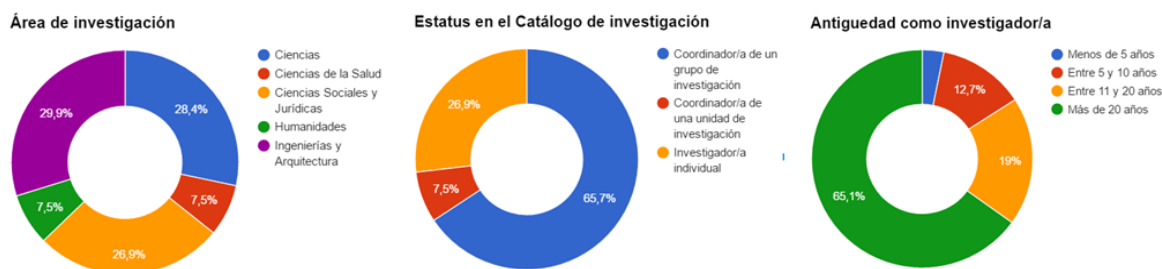
Figura 3: Estructura demográfica de las respuestas obtenidas