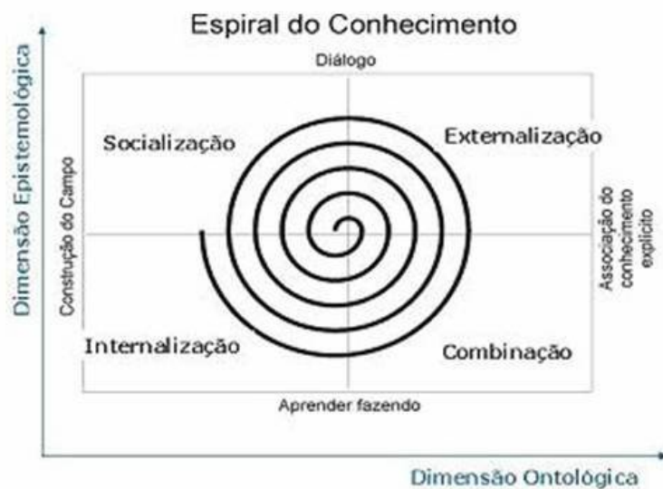
Figura 1 – SECI (Nonaka e Takeuchi, 1995).

Desse modo, o projeto do Núcleo de Gestão da Informação e inteligência da ESDEP tem como fundamentação as categorias de compreensão da espiral do conhecimento de Nonaka e Takeuchi (1995), entendendo que a criação do conhecimento é um processo contínuo de interações dinâmicas entre o tácito e o explícito.